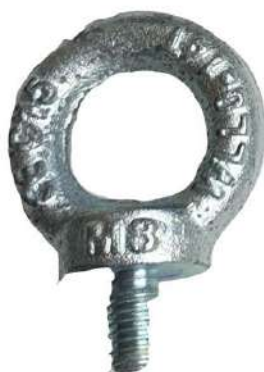
Závesné oko M8